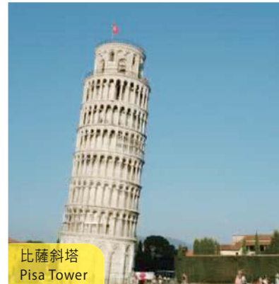
比薩斜塔 Pisa Tower