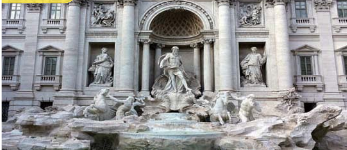
許願池 Trevi Fountain

住宿：The Tower Hotel 或同級 (早、晚餐) Situated between France and Netherlands, Belgium encompasses all the best that Europe has to offer. Admire the stunning architecture dotting the cobblestone squares. Photographing the Grand Place, Manneken Pis, etc. is a "must". On board the Euro Star train, all will arrive London in late afternoon. (B/D)