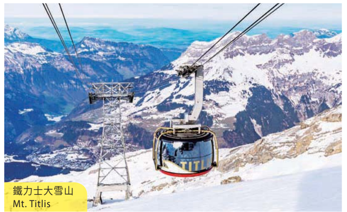
鐵力士大雪山 Mt. Titlis

自助式早餐後，驅車前往 法國最著名博物館-羅浮皇宮 ，特別安排入場參觀，館內珍藏無數，如達文西的「 蒙羅麗莎的微笑 」、希臘出土的 勝利女神 和 維納斯女神像 、古埃及的 獅身人像 等，必定能令你增廣見聞。繼後前往 卡通藝術家天堂蒙瑪特山崗 ，許多未成名畫家集於此地替遊客寫生，而 聖心教堂 又名白教堂聳立於山崗上好像照耀整個花都巴黎的浪漫。繼而領隊可代安排自費乘船