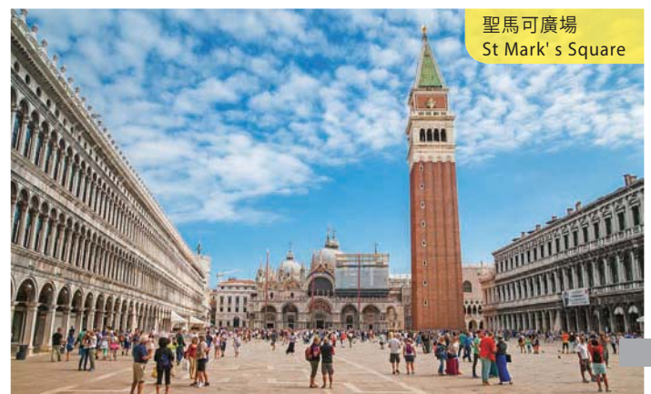
聖馬可廣場 St Mark's Square

自助式早餐後，於指定時間乘車往機場飛返原居地。(早餐) Transfer to airport for a pleasant home ward flight. (B)