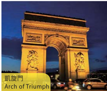
凱旋門 Arch of Triumph