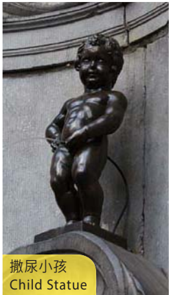
撒尿小孩 Child Statue

住宿：Novotel Hotel 或同級 (早、晚餐) Coach to Zaanse Schans to visit cheese/wooden shoes making factories and view windmills. Later on, proceed to Amsterdam for a canal cruise in a boat with glass roof, followed by a visit to a diamond cutting factory. (B/D)