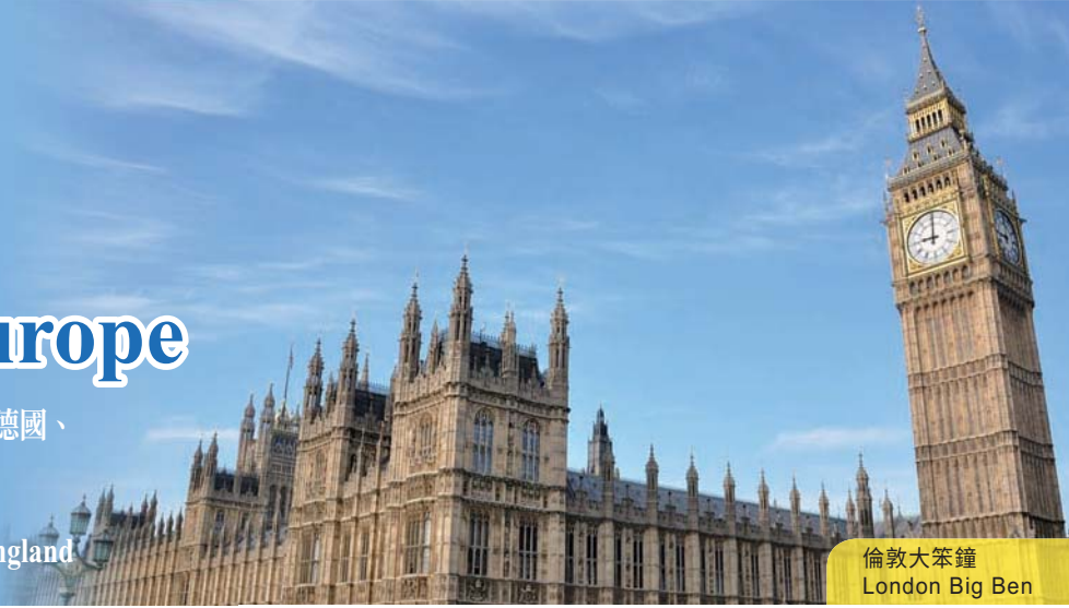
倫敦大笨鐘 London Big Ben

Visiting: Italy, Vatican, Switzerland, France, Luxembourg, Germany, Netherlands, Belgium, England