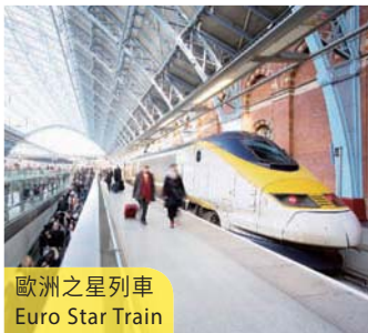
歐洲之星列車 Euro Star Train

住宿：Astoria Hotel 或同級 (早、晚餐) Coach to Milan. Sightseeing tour includes the Duomo and La Scala Opera House in Milan. Shopping in Milan will be the highlight in the afternoon. Later on, proceed to Lucerne via the St. Gottard Tunnel. (B/D)